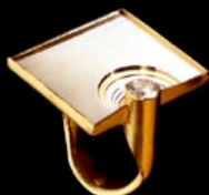
Karl-Heinz Reister Spilla in oro, madreperla e acciaio.