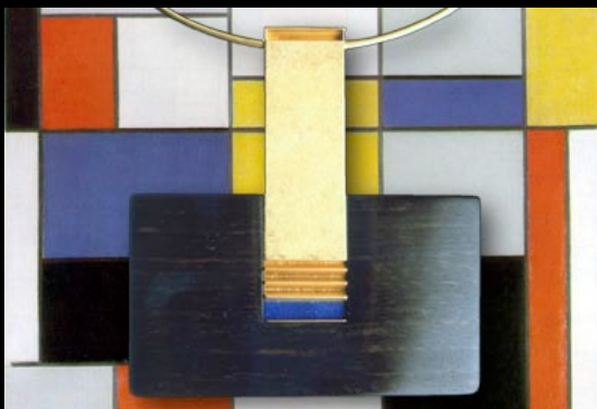
Immagine di fondo: Composition with black, Red, Gray, Yellow, and Blue di Piet Mondrian, 1920 (particolare)